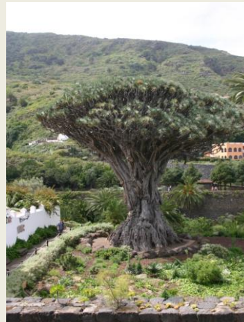
Foto: Drachenbaum auf Teneriffa

Starten Sie jetzt, wenn Sie sich für die nächsten Jahre einen Wettbewerbsvorsprung verschaffen wollen!